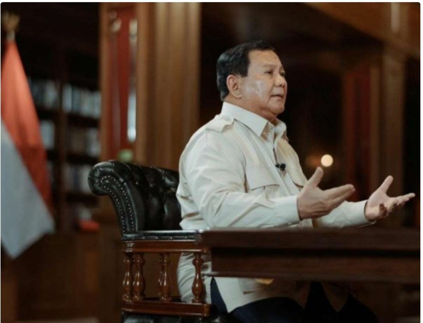
Prabowo Subianto Presiden RI 2024-2029

PENDIDIKAN - Indonesia dikenal sebagai negara yang kaya akan sumber daya alam. Dari hasil tambang yang berlimpah, laut yang luas dengan kekayaan hayati yang melimpah, hutan yang menjadi paru-paru dunia, hingga sumber daya energi